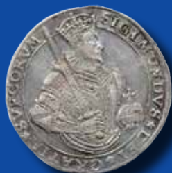
1 daler 1594 "SIGIMVNDVS" 677.000 kr

Ett urval mynt (inkl. köparprovision) som vi har sålt tidigare: