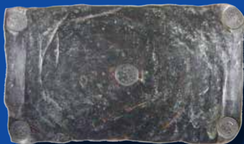
8 daler 1660 2.117.000 kr