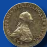
Ryssland 5 rubel 1762 460.000 kr