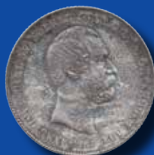
Norge 1 speciedaler 1861 med B under bilden 2.238.000 kr